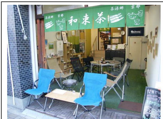
アウトドア風のカフェ