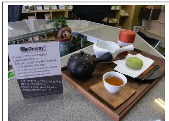
日本茶とのコラボレーション